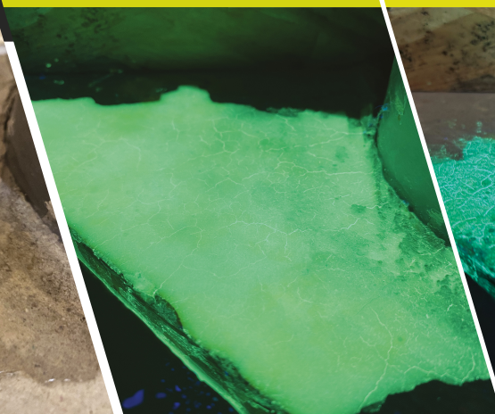
ANTES DEL SECADO (BAJO UV)